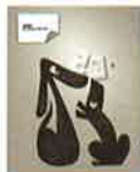
GAS BOOK 23 KUNTZEL+DEYGAS