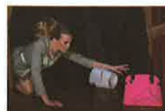
VUEGER & VANDAM