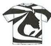
Under the water / Toshifumi Tanabu