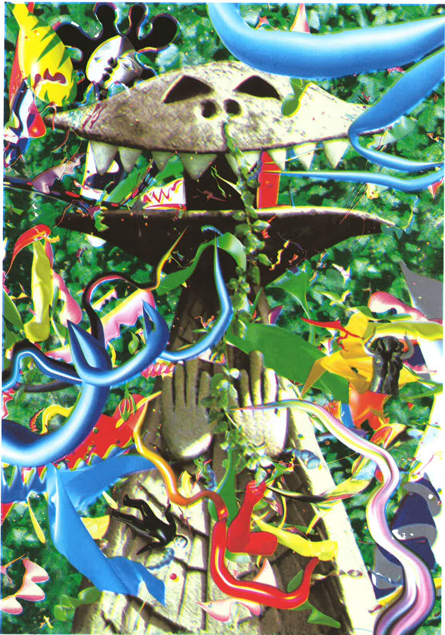
「タナカカツキの太郎ビーム! 展」 / 岡本太郎記念館ポストカードデザイン / 2007 / タナカカツキ